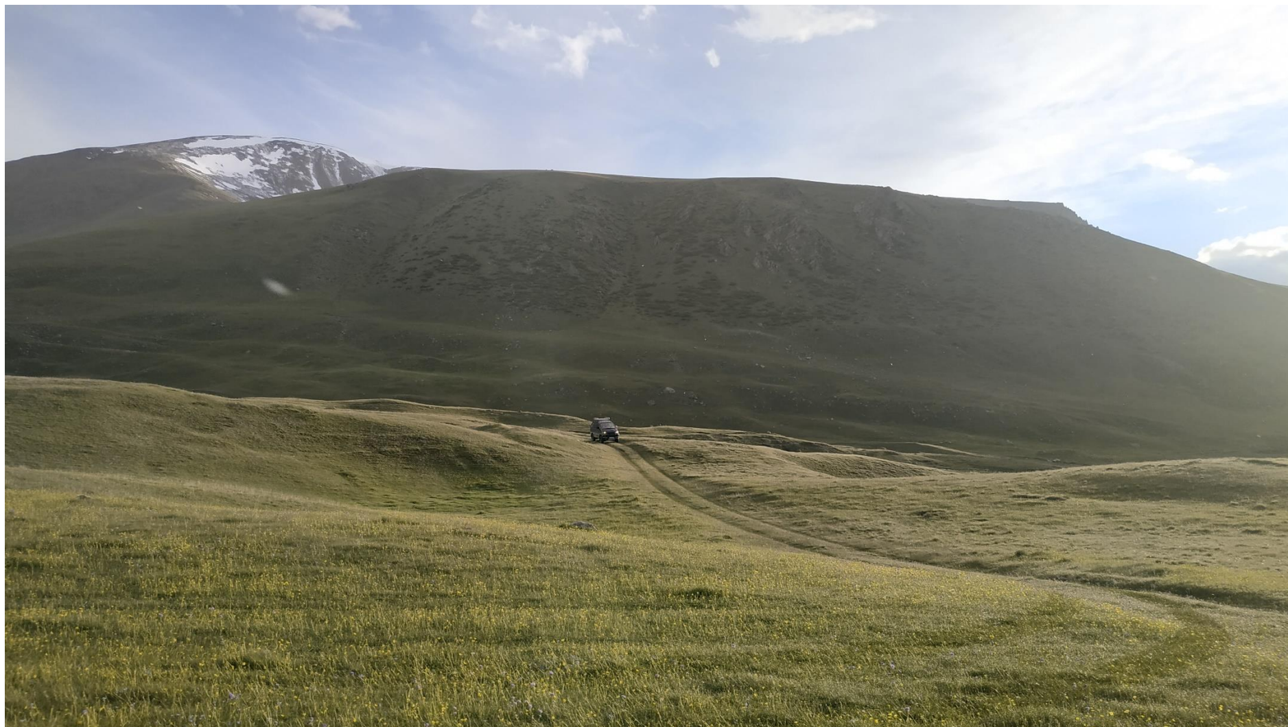
Альпийские луга верхней трети дороги

19:40 – прибыли к очередному броду. Дальнейшая колея визуально не просматривалась. В связи с поздним часом было принято решение не искать в сумерках наощупь дорогу, а разбить лагерь в этом месте.