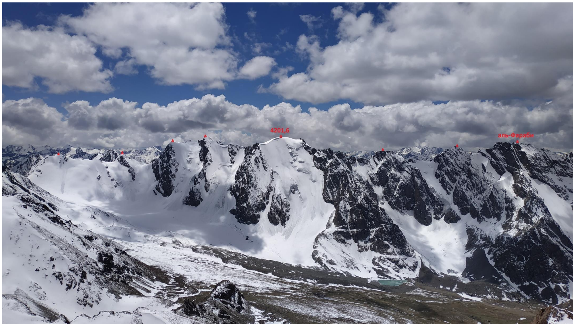
Вид с пика Панорама на Юг на основную часть цирка ледника Мерке

Необходимо отметить, что восхождения на вершины этой части гребня, требуют определения наиболее простых и безопасных вариантов спуска. Спуск по северным снежно-ледовым склонам в июне лавиноопасен, в июле-августе возможны частые камнепады.