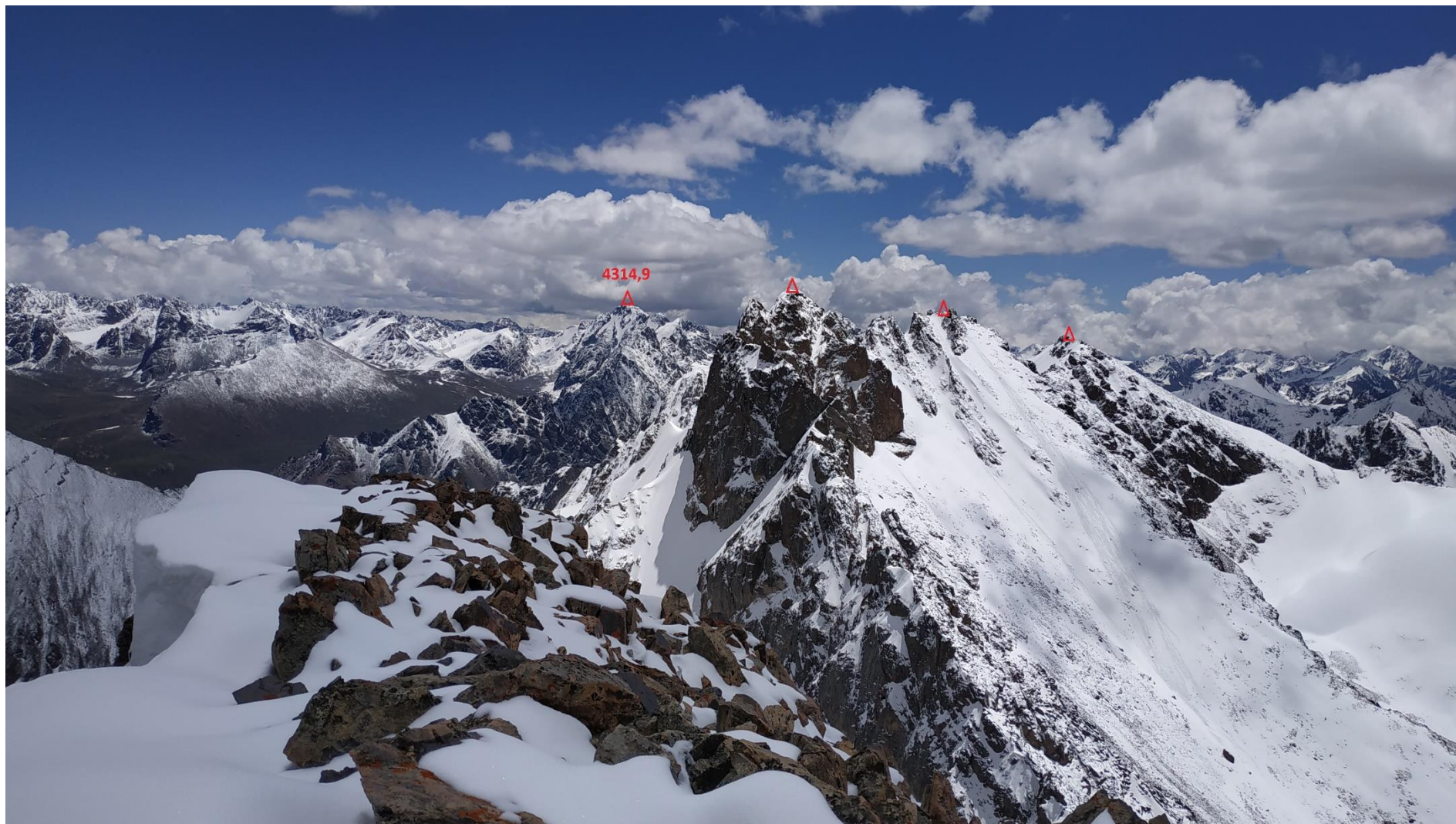
Пик «4314,9» - высшая точка района. Находится в соседнем ущелье Аспара. Подход из цирка Мерке к нему возможен через безымянный перевал (ок. 4000м н.у.м.) в верхней части цирка.

С пика Панорама был отснят цирк Мерке и окрестностей. Анализ показал, что в цирке Мерке находится порядка 15 вершин высотой от 3900 до 4200м н.у.м. Перепад высот маршрутов от ледника до вершин 600-800м. Предполагаемое количество линий возможных маршрутов 1-4 к.тр. – около 50, много комбинированных. На некоторые вершины просматриваются длинные гребневые маршруты, предположительно 5 к.тр.