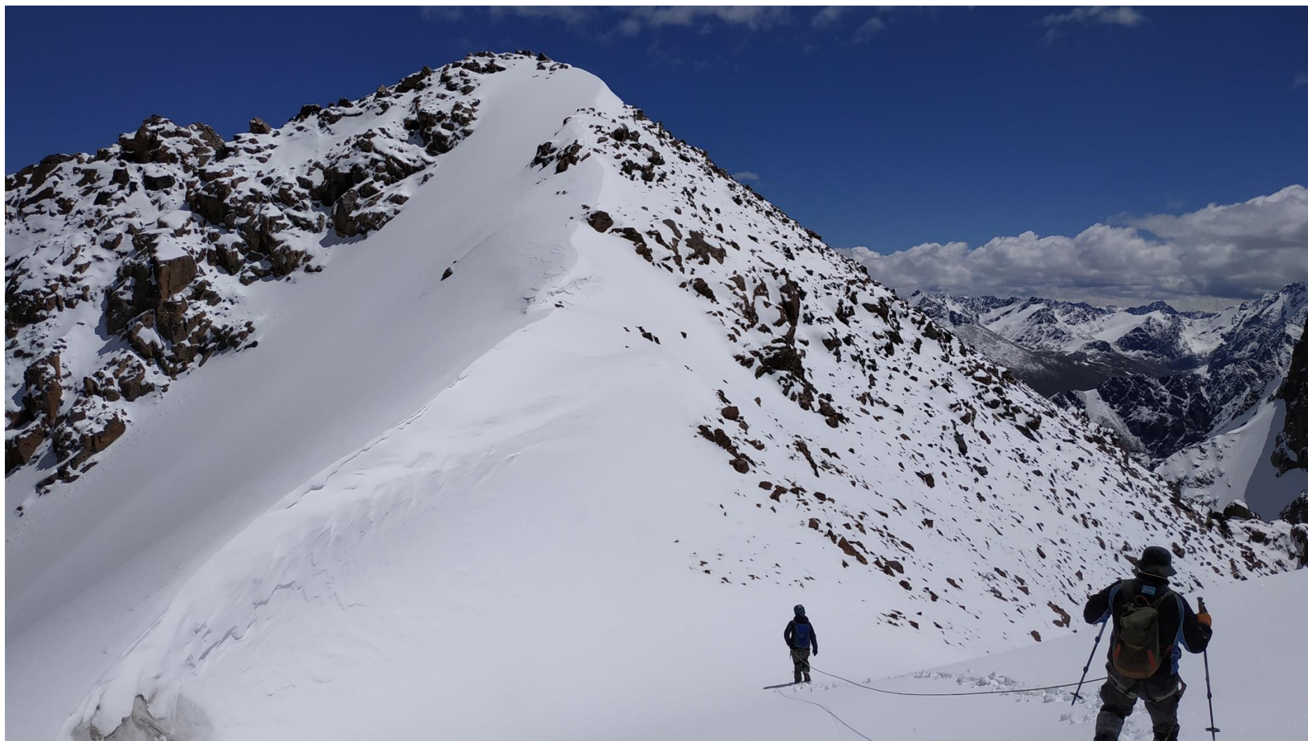
Пик Панорама 4069м, 1Б

07:00 – группа в составе Скопин-Мурсаитов-Ташмамбетов вышли из БЛ в цирк ледника Мерке. Для восхождения была выбрана вершина, своими осыпными склонами находящаяся почти в центре цирка Мерке. Маршрут прошел по южному склону на предвершину, далее в связках с одновременной/попеременной страховкой в 12:10 дошли до высшей точки. Тур на вершине отсутствовал, следы пребывания людей тоже. Высота 4135м. Дали название вершине «пик Панорама». Спустились в БЛ в 16:00.